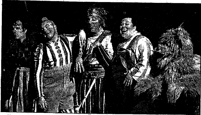
Des artistes de 15 nationalités en moyenne travaillent ensemble pour créer un spectacle du Cirque et le livrer.